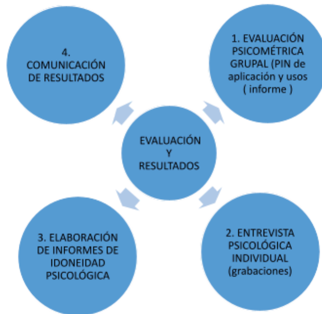
Figura 2. Esquema de evaluación y comunicación de resultados.

Una vez receptados los informes del equipo evaluador por parte de la Dirección Nacional de Talento Humano, quien verificará que conste toda la información solicitada, así como el informe de candidatos idóneos y no idóneos, luego de lo cual previa validación se remitirá a la Dirección General para su aprobación. Cabe indicar que la idoneidad estará en base a los indicadores establecidos en el Art. 64 del Código Orgánico de la Función Judicial, en donde, el psicólogo evaluador deberá identificar la presencia de cuadros psicopatológicos, fobias, traumas, complejos o cualquier alteración psicológica que les impida cumplir a cabalidad las funciones inherentes al cargo.